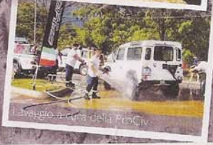
Lavaggio a cura della ProCiv